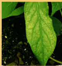
光化学スモッグの影響で、白色斑点が入ったアサガオの葉