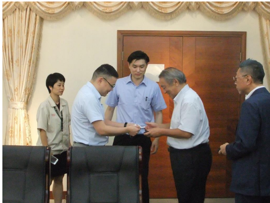
左から 2 番目 田COO、3 番目王マネージャー