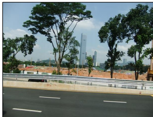
空港からバスで移動中の香港の風景