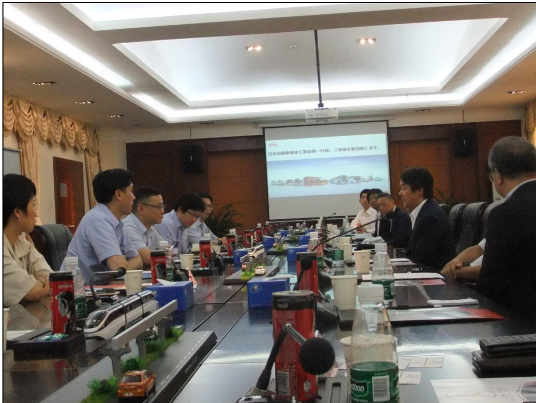
視察のお礼の言葉（部会長より）