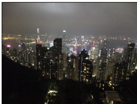
夜は、香港の夜景を見学