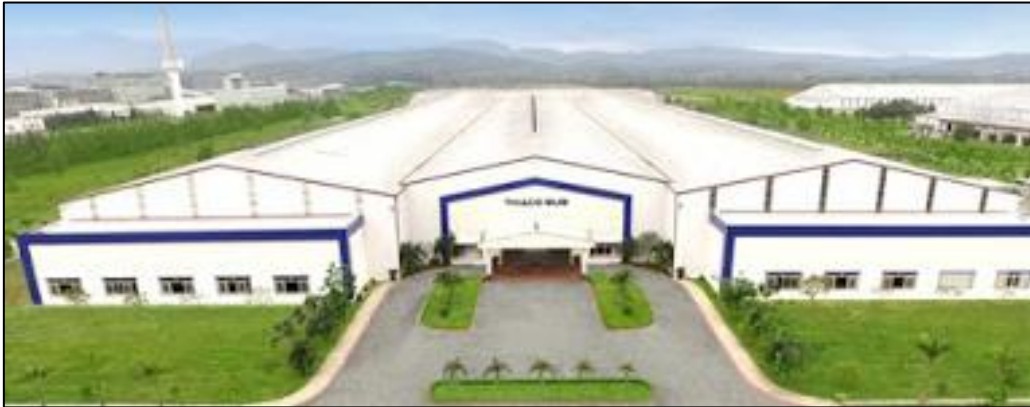
THACO BUS 工場