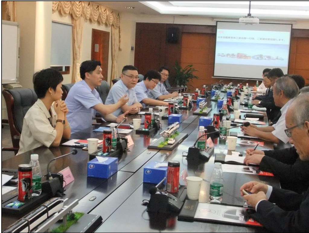
視察後のディスカッションも活発に行われた