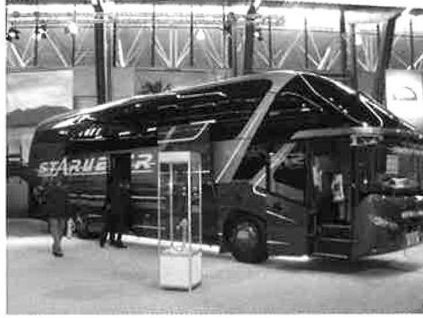
NEOPLAN社製「スターライン」

②所感等 観光バスは外観デザインが大胆な車両が多く見受けられた。特にNEOPLAN社製「スターライン」は目立った。路線バスは、ほとんどがノンステップバスで車椅子乗降用スロープもオートタイプが多かった。欧州各都市でも数多く走っていたが、連接バス車両が数多く展示されており、今後台数が更に増えていくものと思われる。 ノンステップバスの握り棒色が赤、黄、