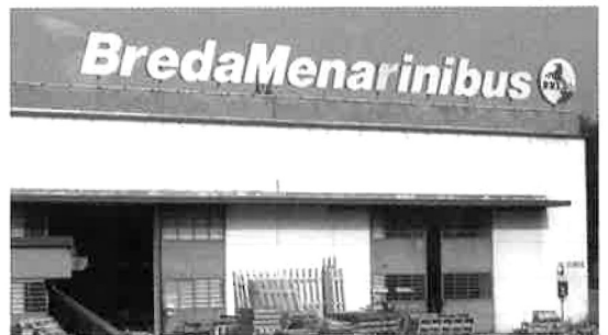
ブレダ・メナリーニ社 外観

緑等さまざまあり、リアフリーを考慮して決めた日本NS基準の黄赤色のように統一色とする考えはない様子。 バス車両、部品が一同に展示されており、欧州の最新デザイン（デザインの方向性）、新しい部品など非常に役に立つ視察であった。今回の「Bus World 上海」（2007年10月）も注目したい。