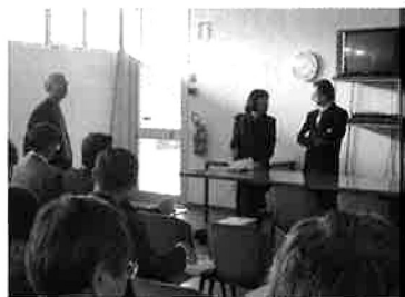
会社説明 意見交換会