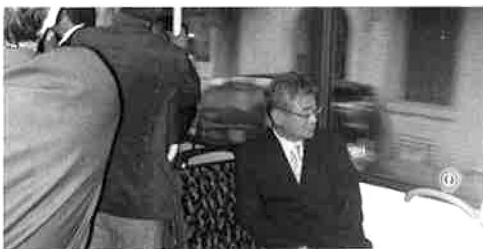
天然ガス車でベルリン市内を試乗