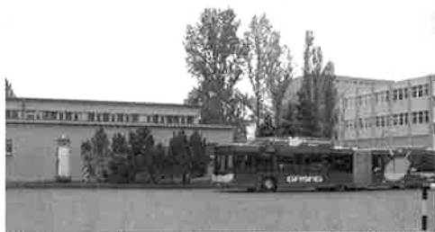
ハル・ライゼン社 外観

（社）日本自動車車体工業会バス部会・資材部会で、2005年度の部会事業計画に則り、10月22日（土）～30日（日）の間、ベルギーのコルトレイクで行われた欧州バス見本市「Bus World」及びバス関連施設の視察を行った。 今回はジェイ・バスグループも交え、総勢34名による大所帯の視察団で、ドイツ、ベルギー、イタリアの3カ国を訪れた。